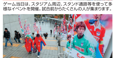
ゲーム当日は、スタジアム周辺、スタンド通路等を使って多様なイベントを開催。試合前からたくさんの方が集まります。

すべてのゲートの入場階段及び、スタンド通路に掲示しますので、たくさんのサポーターの目に触れることが想定されます。