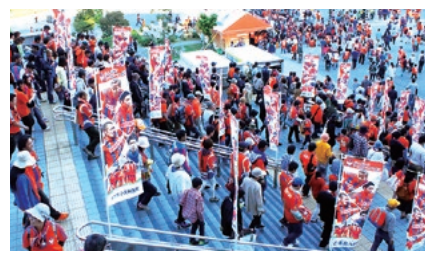
ゲーム当日は、スタジアム周辺、スタンド通路等を使って多様なイベントを開催。試合前からたくさんの人が集まります。