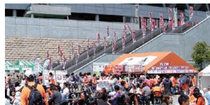
すべてのゲートの入場階段及び、スタンド通路に掲示しますので、たくさんのサポーターの目に触れることが想定されます。