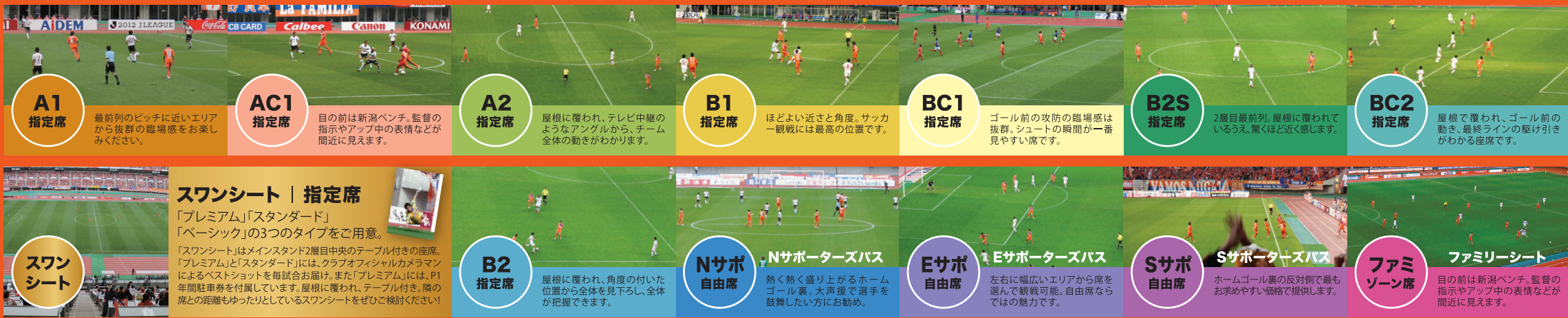
※Eスタンド自由席エリアで、中央部は16列目から上となります。右の座席図をご参照ください。 ※対戦カードによっては、1層目でご観戦いただけない場合がございます。予めご了承ください。 ※お求めやすい価格で、ご家族そろっての観戦はファミリーシートが大変お得!