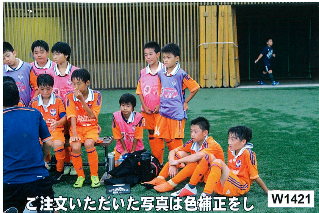
ご注文いただいた写真は色補正をし フジファイルム銀塩ペーパーに写真プリント 致します。 W1421