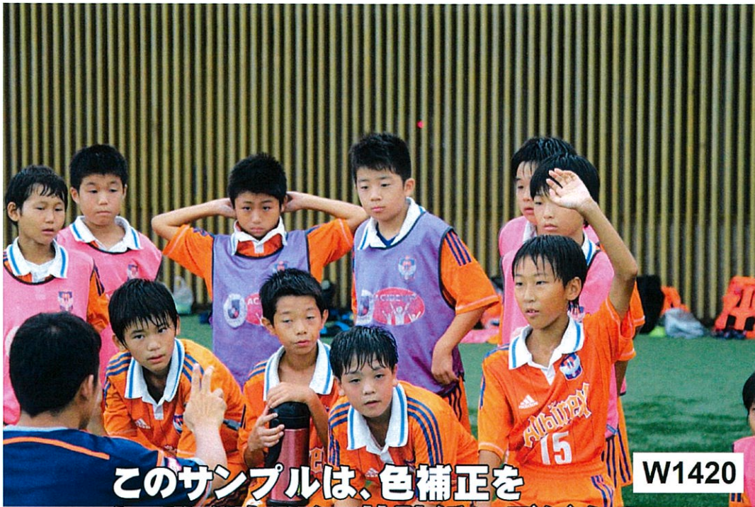
このサンプルは、色補正を しておりません。特殊紙にデジタル 印刷した画像です。 W1420