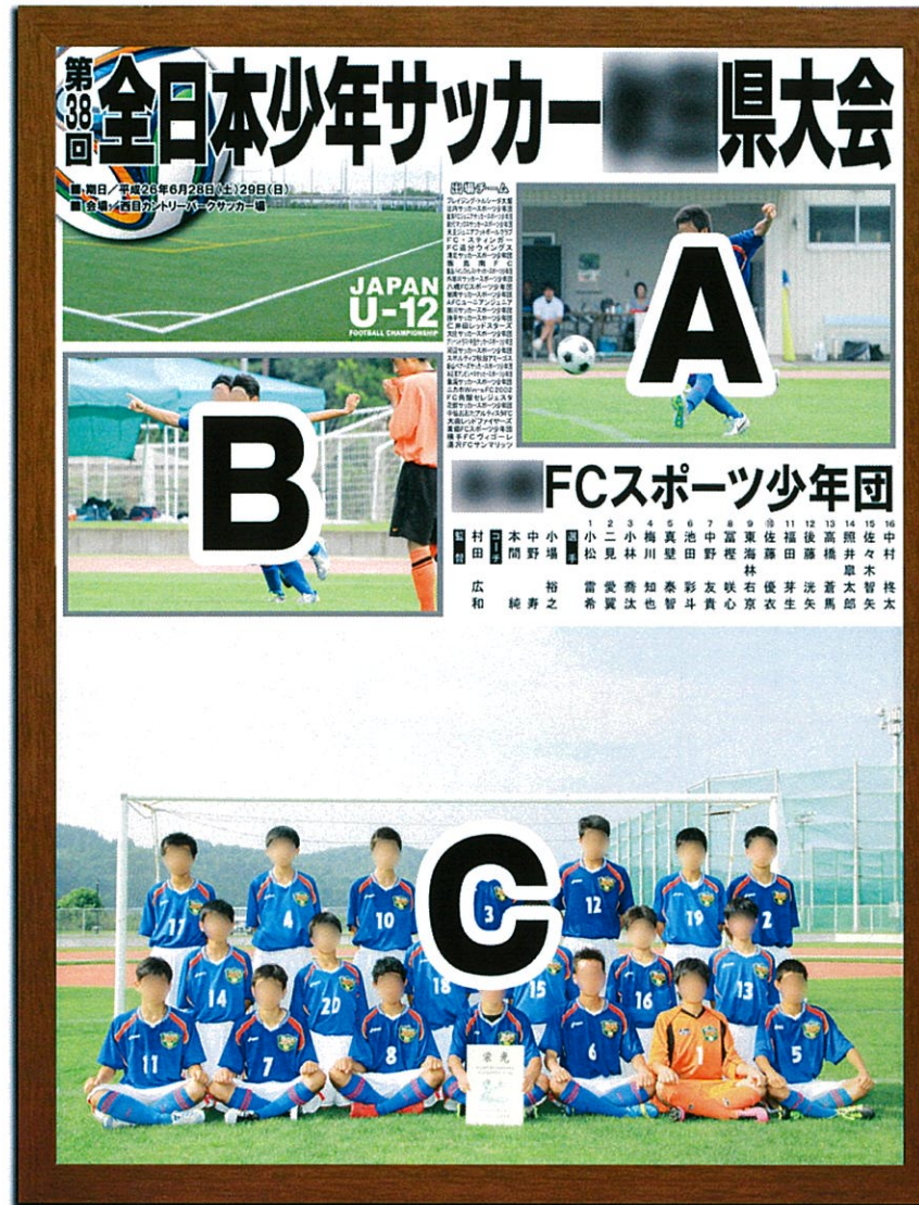
上記画像はA3パネルになります

大型パネル M3 4,000円 中型パネル A3S 3,190円 (A・B欄に好きな写真を入れて) 詳細は別紙パンフレットをご覧ください。