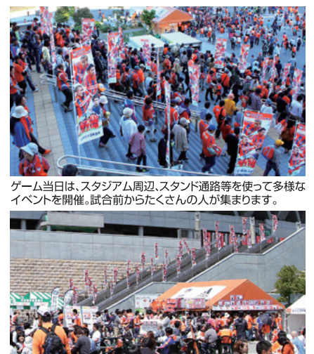
ゲーム当日は、スタジアム周辺、スタンド通路等を使って多様なイベントを開催。試合前からたくさんの人が集まります。