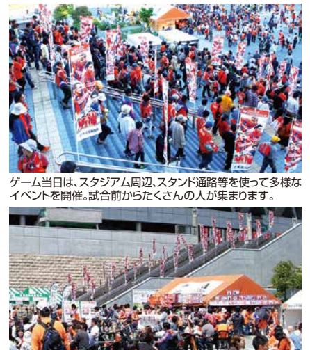
ゲーム当日は、スタジアム周辺、スタンド通路等を使って多様なイベントを開催。試合前からたくさんの方が集まります。